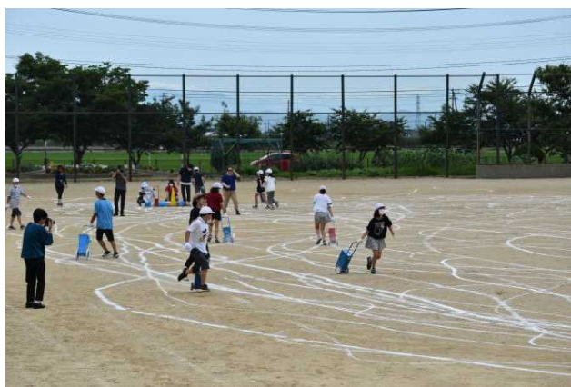
写真：「水と土の芸術祭2018」での小学校でのワークショップ

9:00 9:20 10:35 10:50 11:20 11:25 11:55 12:05 13:00 16:00