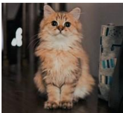
*画像編集・加工可